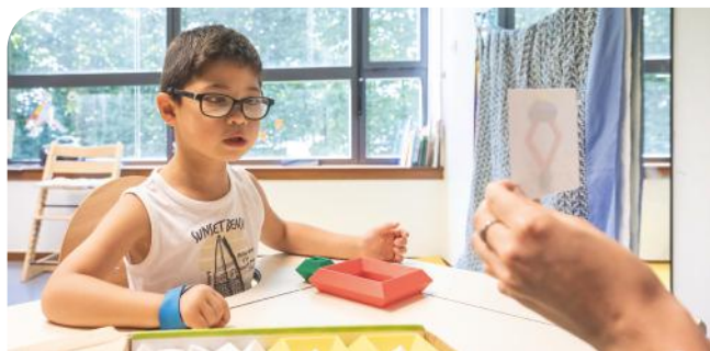
Schéma national d'organisation sociale et médico-sociale 2021-2025